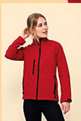
SOL'S ROXY 46800